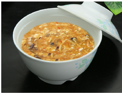
4. 酸辣湯(sanrātan) Hot and Sour Soup