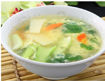
5. 玉子スープ(tamagosūpu) Egg Soup