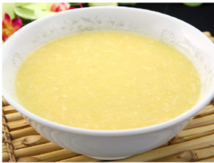
1. コーンスープ(kōnsūpu) Corn Soup