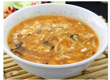
3. 酸辣湯(sanrātan) Hot and Sour Soup