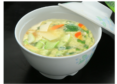
6. 玉子スープ(tamagosūpu) Egg Soup