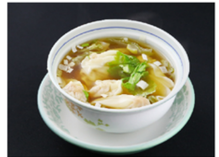
6. ワンタンスープ(小)(wantansūpu) Wonton Noodles in Soup