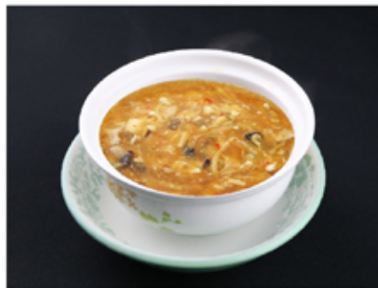
11. 酸辣湯(小)(sanrātan) Hot and Sour Soup