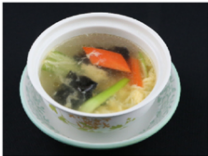
4. 玉子スープ(小)(tamagosūpu) Egg Soup