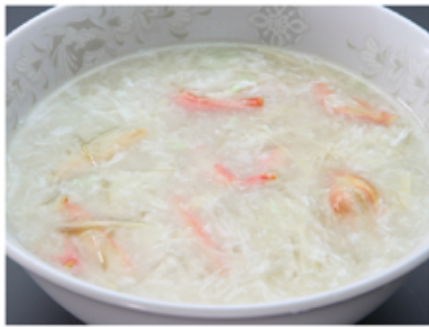
7. フカヒレスープ(fukahiresūpu) Shark-fin Soup