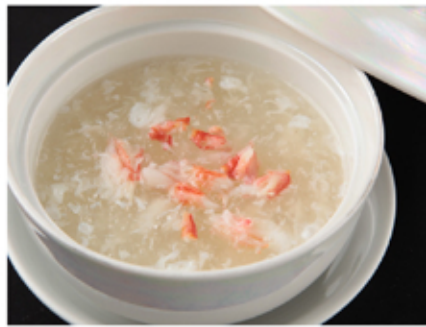
8. フカヒレスープ(小)(fukahiresūpu) Shark-fin Soup