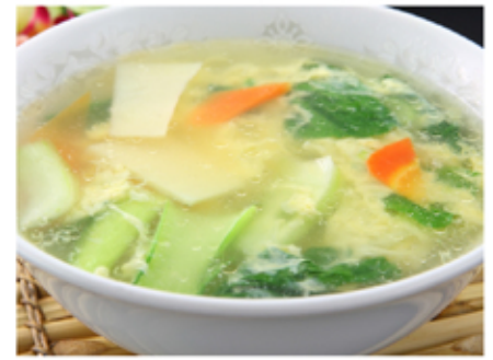
3. 玉子スープ(tamagosūpu) Egg Soup