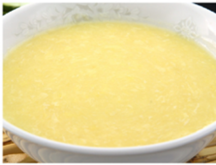
1. コーンスープ(kōnsūpu) Corn Soup