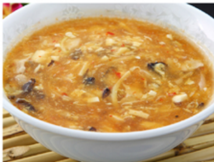
10. 酸辣湯(sanrātan) Hot and Sour Soup