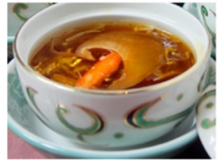
9. フカヒレの姿煮の中華スー プ(fukahirenosugataninochuukasūpu) Shark Fin Simmered Whole Chinese Soup