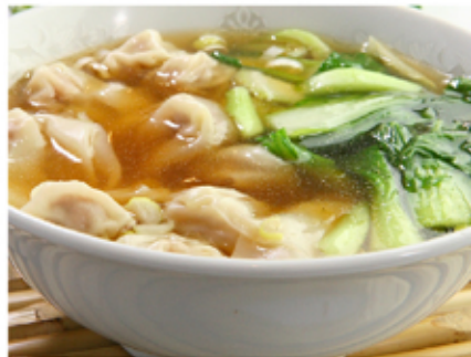
5. ワンタンスープ(wantansūpu) Wonton Noodles in Soup